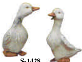
S-1428 2 Gänse Höhe 10 cm rechts und links schauend