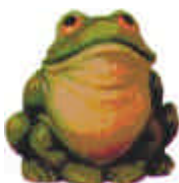
Frosch S-2007 Länge 13 cm