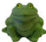
Frosch S-2008 L: 7,5 cm