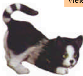
S-1124 Katze spielend L: 16 cm