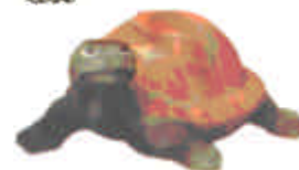
Schildkröte S-3481 Länge 17,5 cm