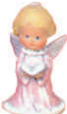
S-2322 und betend