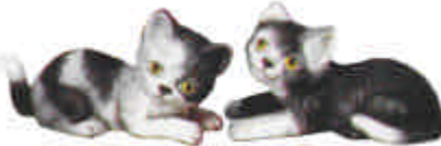
S-583 2 Kätzchen liegend L: 9 cm