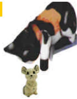
S-1396 Regalkatze und Maus 17,5 + 5 cm