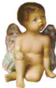
S-2524 Putte sitzend mit abgewinkelten Knie Höhe 17,5 cm