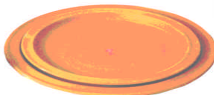
Teller mit ca. 12 mm Rand