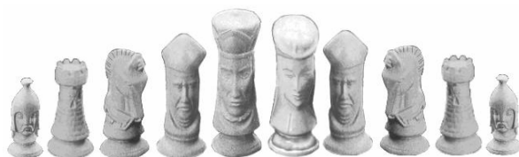
GC-16 Schachspiel Flämisch 2 Formen Höhe 7 bis 10 cm