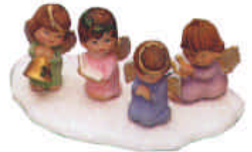
RV-1023 3 Engelchen Höhe 6 cm