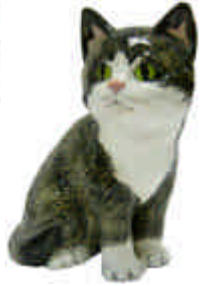
S-1122 Katze Höhe 16,3 cm