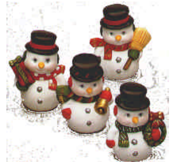
RV-815 4 Schneemänner Höhe: 7,5 cm