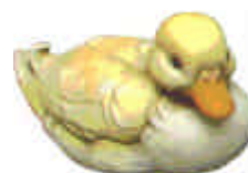
2 Schwimmenten S-594 H: 10 cm, L: 19 cm