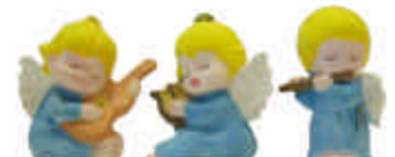
RV-1040 3 kleine Engel musizierend Höhe ca. 6 cm