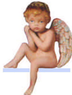
S-2523 Putte Hände an der Wange H: 17,5 cm