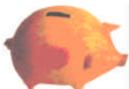
Sparschwein dick GCH-34 L:17 cm