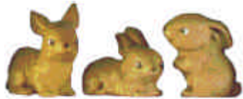
S-941 3 kleine Hasen Höhe 5 cm