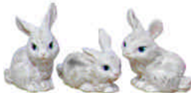
S-306 3 Häschen Höhe 7,5 cm