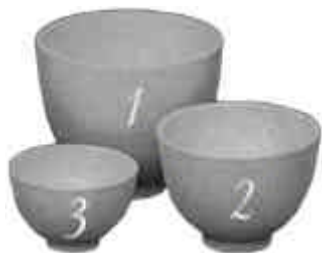
CB-390 Schälchen Ø 13 H:7 cm