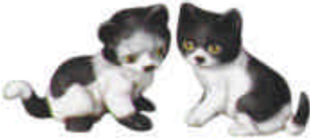
S-584 2 Kätzchen