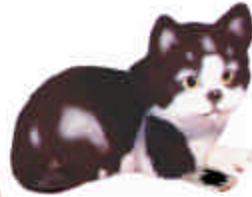
S-1123 Katze liegend H: 15 cm