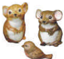
A-187 2 Mäuse und 1 Vogel Höhe ca. 4,8 cm