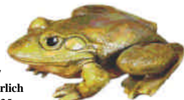
S-1497 Frosch natürlich Länge 25 cm