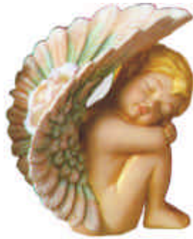
Putte mit hohen Flügeln S-3065 und S-3066 Höhe 15 cm