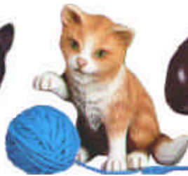
S-2364 Katze spielend L: 16 cm