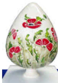
Rosenspitz bauchig CB-03 Höhe 25 cm Ø 17 cm