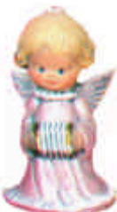
S-2223 mit Akkordeon,