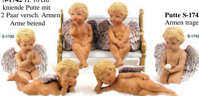
S-1550 mittlere Putte auf dem Bauch liegend 17,5 cm