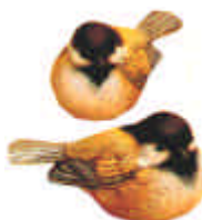
RV-521 2 Vögel ca. Länge 7,5 cm Höhe 4,5 cm