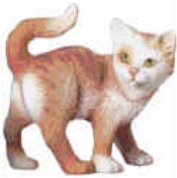
S-2368 Katze stehend L: 15,5 cm