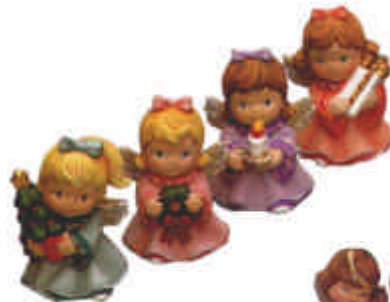
RV-816 4 Engelchen Höhe: 7,5 cm