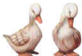
2 Gänse S-1429 Höhe 10 cm