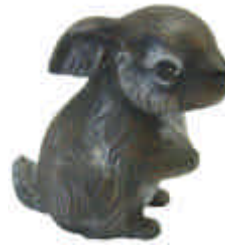
S-1079 und S-1077 natürliche Hasen Höhe: 15 cm links / rechts schauend