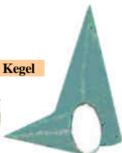
GCH-701-18 Ø 10 cm