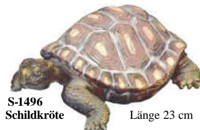
S-1496 Schildkröte Länge 23 cm