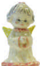
S-1009 mit Buch