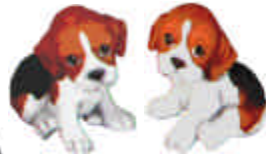
S-589 3 Welpen ca. Höhe 6,5 cm