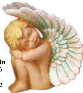
2 Putten klein S-3032 Höhe 10 cm 2 in 1 Form