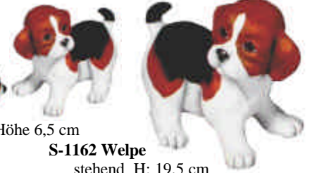
S-1162 Welpe stehend H: 19,5 cm