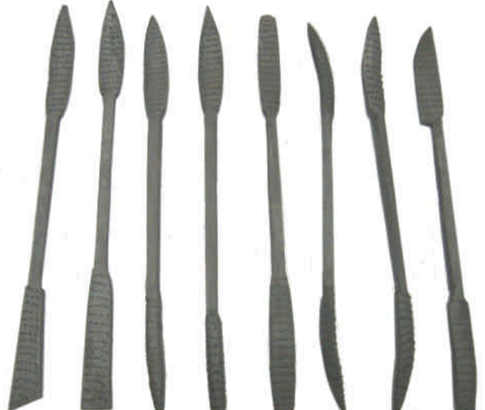
RS-06 -07 -02 -01 04 -03 -05 -08

Raspeln einzeln erhältlich RS-01 bis RS-08