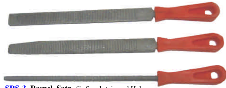
SRS-3 Raspel-Satz für Speckstein und Holz 3 versch. Raspeln ca. 30 cm lang